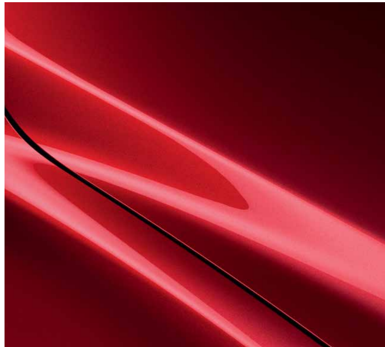
Soul Red Crystal Metallic