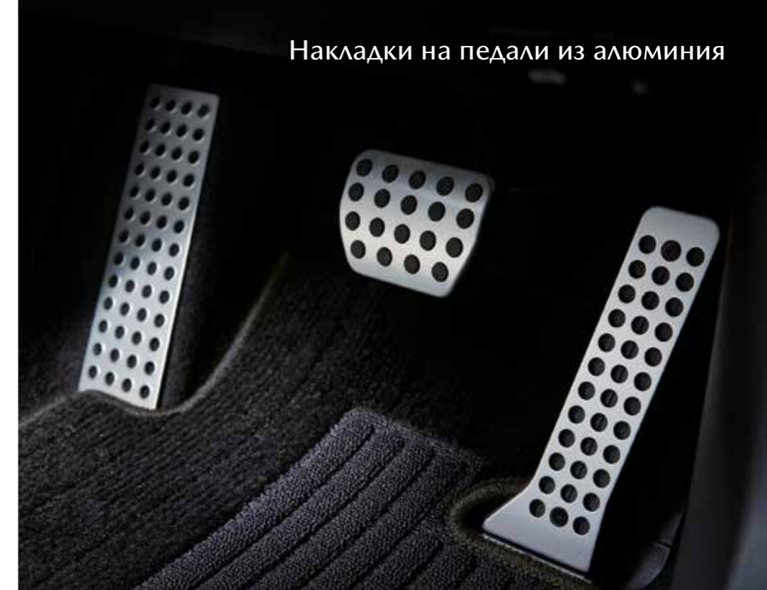
Накладки на педали из алюминия