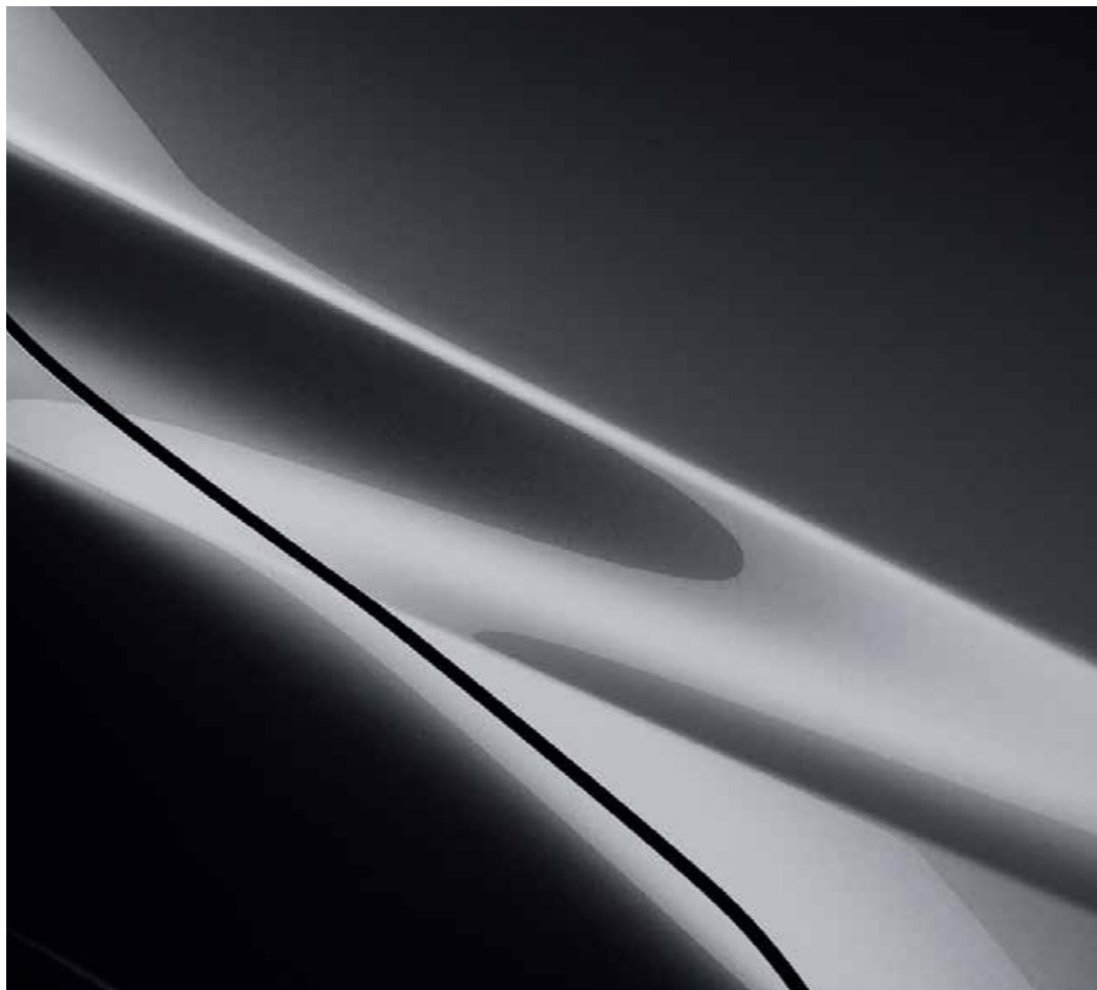
Machine Gray Metallic